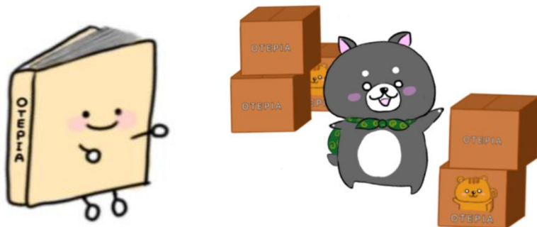
▲etc…さんのオリジナルイラスト