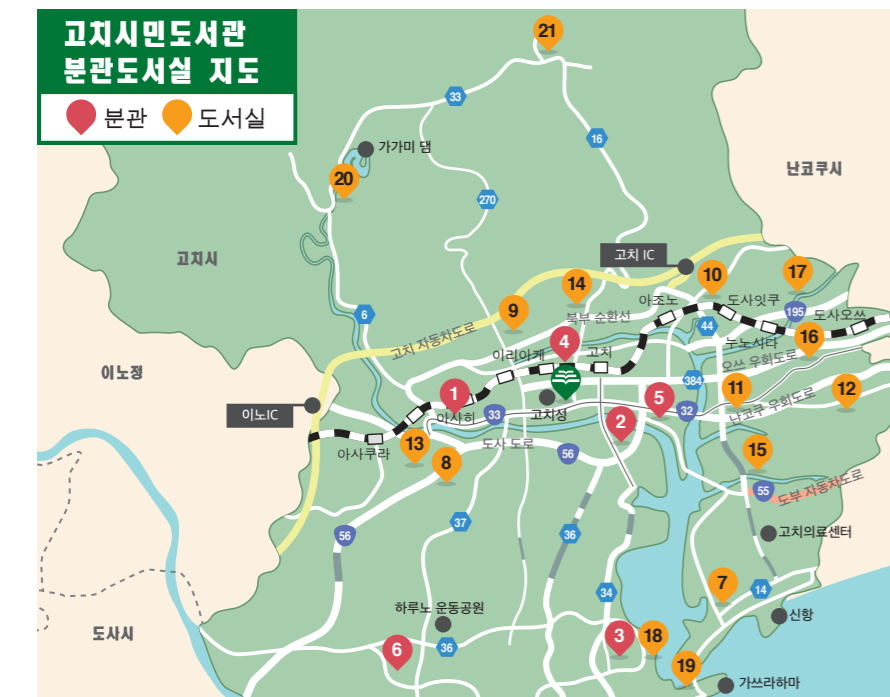
상세한 지도는 별도의 이용안내 또는 본 도서관 웹사이트를 참고해주시기 바랍니다.

◆ 이동도서관(도서관 버스) 고치 시내에 거주, 근무, 재학 중인 분은 이용할 수 있습니다. 대출하기 위해서는 이동도서관용 이용카드가 필요합니다. 순회 일시와 장소 등은 본 도서관 웹사이트에서 확인하시거나 시민도서관의 이동도서관 담당자에게 문의해주시기 바랍니다. (전화 088-824-8225)