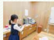
7月22日(土) ひものぼり