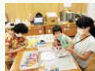
9月10日(日) 上手に着地するネコ