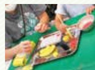
10月1日(日) 化石のレプリカづくり