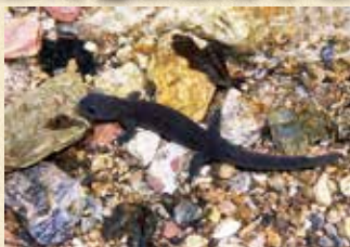
イシツチサンショウウオ