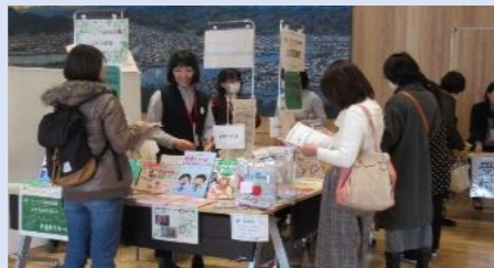
出前図書館(講座等のテーマに合った本を会場で貸し出すサービス)