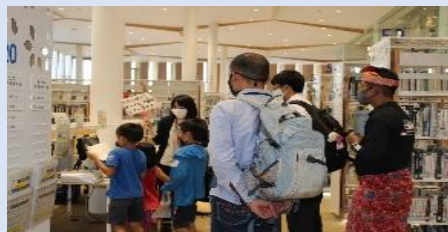
県内在留外国人等を対象としたオーテピア館内ツアー