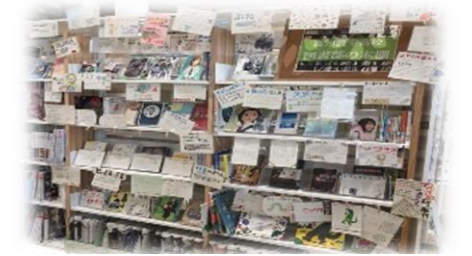
高知農業高等学校図書部との連携展示