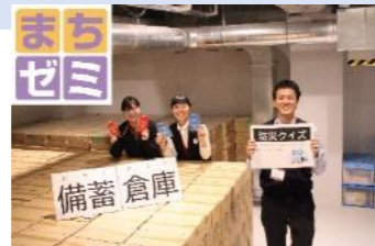
「高知まちゼミ」に参加