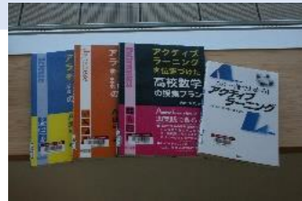
セット貸出し（例） 「アクティブラーニング」