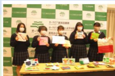
春野高等学校から布絵本の寄贈