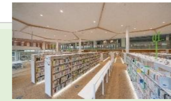
オーテピア高知図書館