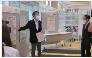
がん患者の感じるコロナウイルスへの不安について(展示説明)