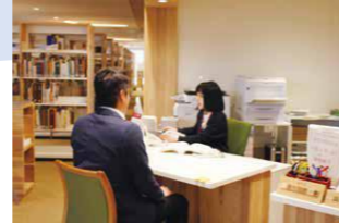
レファレンスの様子