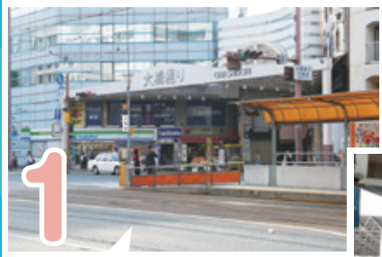
1 最寄りの電停は「大橋通」 大橋通りアーケードを進モロ!