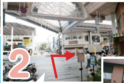
2 ひろめ市場の角を曲がって、 帯屋町アーケードを進モロ!