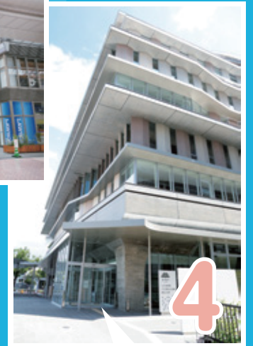
4 正面入口はこちら!