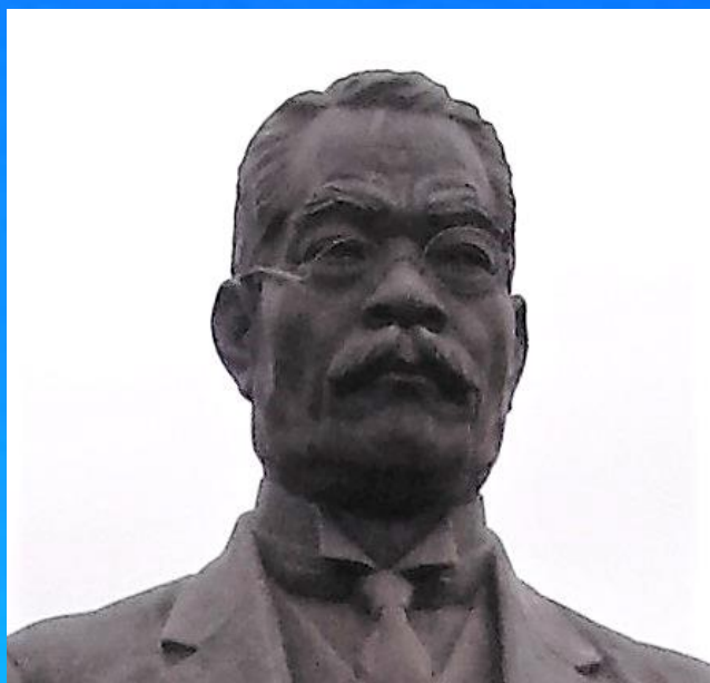
濱口雄幸像(高知市五台山)