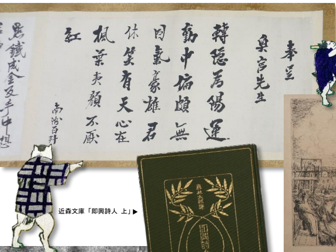
近森文庫「即興詩人上」▶