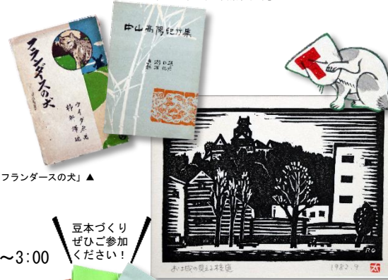
安芸文庫「フランダースの犬」▲