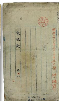
▲ 貴重書「東征記 巻一」

高知市民図書館(1949年開館)は、博物館がなかった高知県で唯一の受け皿として、歴史的・美術的に価値の高い資料を保管してきました。書画や図書、家につたわって来た古文書など、高知県ゆかりの資料の種類は多岐にわたります。当館では、70年にわたってこれらを分類・整理し、「特設文庫」と名付けて保管しています。本展示は、特設文庫から選りすぐった品々を展示し、当館が行ってきた資料整理・保存の取り組みについて紹介します。