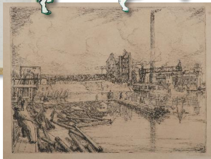
▲ (文庫以外) 美術工芸品「ドイツの製紙工場」