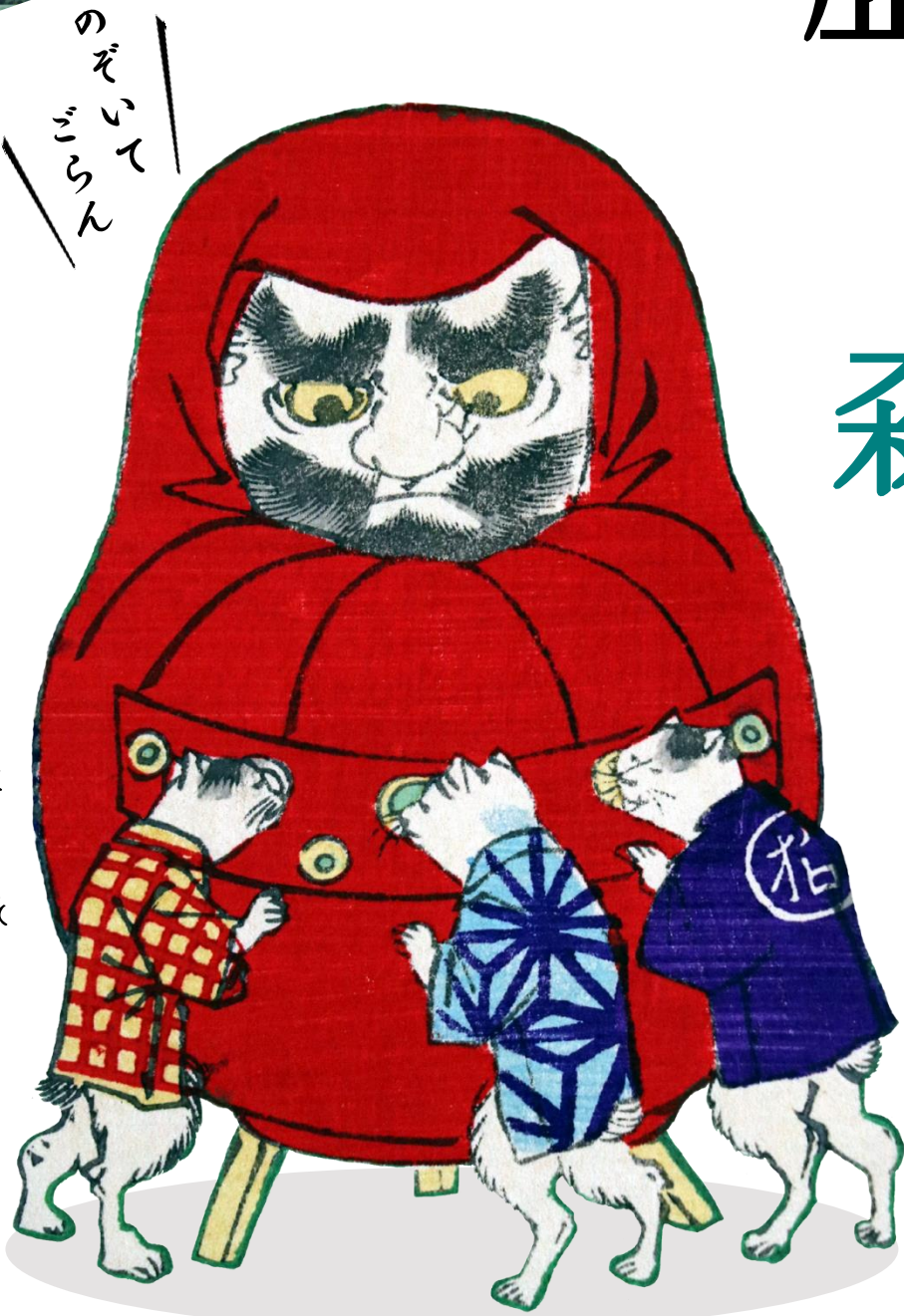
近森文庫「しん板ねこの世界」