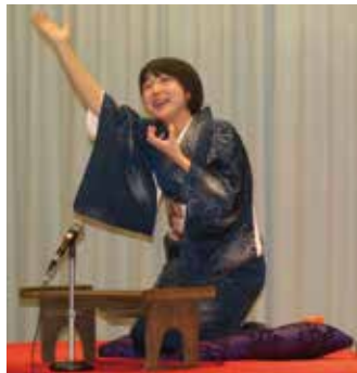
はな や 花の家 こなつさん