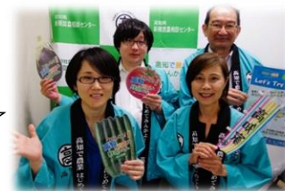
高知県農業会議 就農コンシェルジュのみなさん